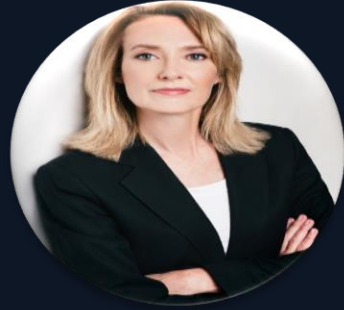
بلانچ کائے چیف فنانشل آفیسر