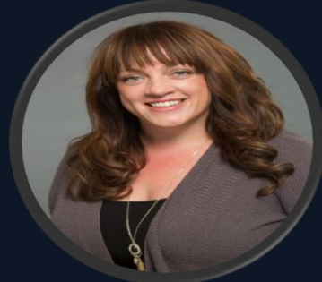
بري ألبير نائب الرئيس